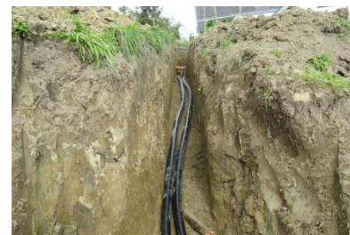
L'eau chaude s'écoule par des conduites à distance vers le consommateur

Le bois de la région, réduit en copeaux, est brûlé dans la centrale. L'eau chaude produite parvient aux immeubles par le biais de conduites à distance (voir image). A cet effet, on utilise deux tuyaux: l'un amène l'eau chaude et l'autre évacue l'eau refroidie pour la reconduire vers la centrale.