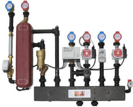
La station de transfert remplace le chauffage dans les immeubles connectés.

Pour les propriétaires d'immeubles connectés, le chauffage à distance est une solution très confortable puisqu'ils n'ont plus besoin d'une installation propre et qu'ils n'ont rien à voir avec le chauffage proprement dit. Ils ne sont p.ex. plus astreints à l'achat de combustible, aux services d'entretien, aux révisions de citerne et aux services des ramoneurs.